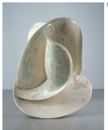
《私自身の》2001 フィアバーガラス、エポキシ樹脂 H160×W230×D180 金沢21世紀美術館蔵 © Tony CRAGG