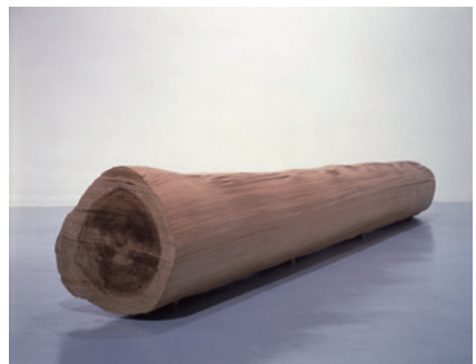
《Wood No.5 CJ》1984 杉 H58×W427×D53 金沢21世紀美術館蔵 © KADONAGA Kazuo