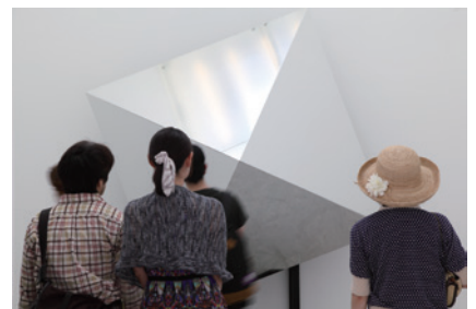
《回転するピラミッドII》2007 鏡、動力装置 H200×W200×D110cm 金沢21世紀美術館蔵 © Jeppe HEIN courtesy: Johann König, Berlin, 303 Gallery, New York, and SCAI The Bathhouse, Tokyo

コペンハーゲン王立芸術アカデミー卒業。円や四角形などの単純な幾何学的形態、白などの無彩色、鏡や透明な素材を多用し、一見1960年代のミニマルズムの作品にも見えるような立体作品を制作する。だが、その作品には観客の動きに反応して動き出す機構が組み込まれていたりするなど、いたずらっぽいユーモラスな作風である。茶目っ気たっぷりに観客の作品に対する緊張感をほぐしながら、観客同士の間コミュニケーションを生み出すことを意図した作品も多い。アムステルダム国立美術館の庭園に設置された噴水やに設置されたコペンハーゲンのカストラップに設置された変型ベンチなど、常設のパブリック・アートも手掛ける。