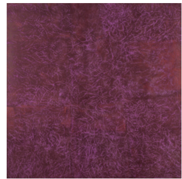
《アマランス色、「輝き」シリーズより》2004 顔料、パステル、バインダー/麻布 H250×W250cm 金沢21世紀美術館蔵 © Monique FRYDMAN

現在、フランスを代表する女性作家のひとりであるモニーク・フリードマンは、1970年代終わりから作家活動を開始した。絵画制作を中心に据え、色と光の表現をカンヴァス、顔料、パステル、紐、紙などの素材を用いて追求する。自身の身体と素材との親密で双方向的なダイアログ（対話）の中で浮かび上がっていく色やイメージには、時には作家自身も気がつかなかった自らのルーツや過去の記憶の断片が表出し、我々ひとりひとりの記憶や心をも揺さぶる。近年では、ガラスやプレキシガラス、紙や布などを用いたサイト・スペシフィックなインスタレーション（特定の場所に帰属する作品）も手掛けている。