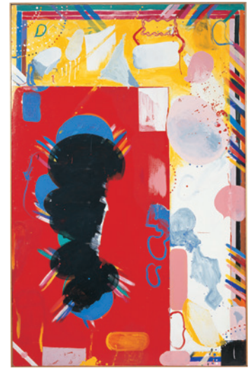
《作品》1963 アクリル/カンヴァス H212.2×W136.4cm 金沢21世紀美術館蔵 © YAMAZAKI Tsuruko

山崎つる子は1954年に結成された「具体美術協会」の草創期のメンバーであった。その後もAU（アーティスト・ユニオン）、展覧会等、様々な活動において、ブリキを用いた立体、パフォーマンス、絵画といった多様な作品の制作を行っている。数十年に及ぶ制作活動を通して、山崎は一貫して実像と虚像、視覚・認知・再現をテーマに制作を続け、個と世界との関わりについて独自の視点で表している。「具体美術協会」のリーダーであった吉原治良が述べた「他人のやらないことをやれ」に象徴される前衛的な美術論はその後の山崎の制作活動に多大な影響を与えた。