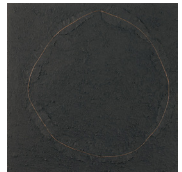
《bacteria sign (circle)》2000 土、枯葉、アクリル/木製パネル H45×W45×D0.9cm 金沢21世紀美術館蔵 © SUZUKI Hiraku photo: SAIKI Taku

鈴木ヒラクは、平面、彫刻、インスタレーション、ライブドローイング、映像など、多岐にわたる表現方法を用いながらも、一貫して「書くこと」、「描くこと」について探求している。路上で目にする記号やことば、植物などの自然物やコンクリート片などの人工物まで、様々なかたちを発見し、収集・分解して、再構築することで新たな線やかたちを創造する。音楽家やファッションデザイナーとのコラボレーションなど、ジャンルを横断した活動も多数手がける。