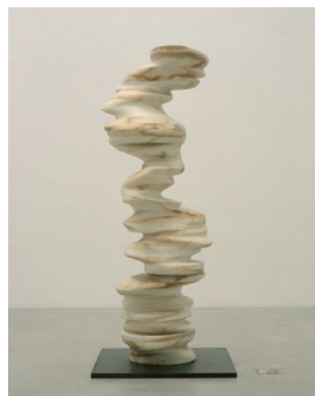
《何とんでも》2001 大理石 H247×W90×D90cm 金沢21世紀美術館蔵 © Tony CRAGG

一貫して、物と物の関係性への洞察を反映させた作品を発表し続けている作家である。その対象は人工物から自然界の物まで幅広く、その形態や機能に目を向けることで深い繋がりを見つけ出す。部分が全体となり全体が部分となってしまうような生命体的感覚を物の配置によって表現したり、物に生じる機能としての使用価値や交換価値の増減にも着目している。近年は特に生命の有機的な形を解析して立体化した彫刻を多く発表している。