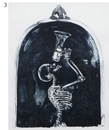
《暗がりの伝道者》2008 リトグラフ 金沢21世紀美術館蔵