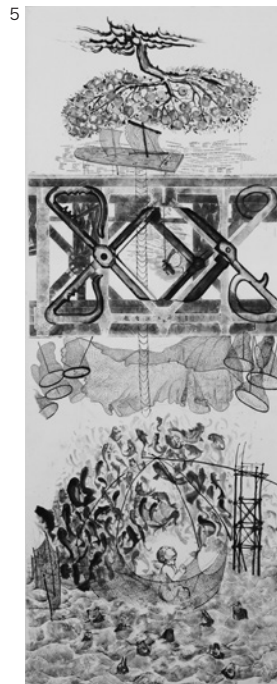
《チウ・ジャワへの30通の手紙 九死に一生を得ていた》2009 紙、インク 作家蔵