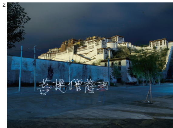
《心経》2005-2018 Cプリント 作家蔵

※アーカイブのため、後日、掲載誌(紙)、URL、番組収録のDVD、CDなどをお送りください。以上、ご理解・ご協力のほど、何とぞよろしくお願いいたします。