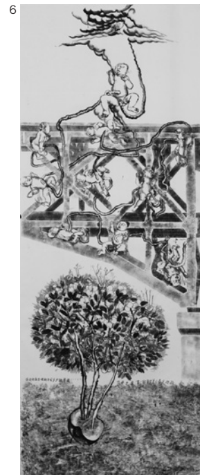
《チウ・ジャワへの30通の手紙 一つのリンゴに何本の木があるか数えよ》 2009 紙、インク 作家蔵