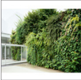
パトリック・ブラン《緑の橋》2004年 金沢 21 世紀美術館蔵