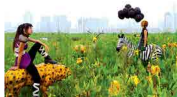
Cao Fei 9 Still from "COSplayers", 2006. Courtesy of Vitamin Creative Space and Cao Fei. ©Cao Fei

ビデオや写真、パフォーマンスなど様々な媒体を用い、ヒップホップやコスプレといった若者文化に顕著な要素を取り上げながら、刻々と変化を遂げる現代社会やそこに生きる人々を鋭い視線で捉えながらもユーモアを交えて映し出していく。中国の現代アートの第1線で活躍するツァオ・フェイの初期作から最新作までを含む映像作品選。