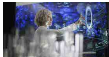
MOON Kyungwon & JEON Joonho 8 "The Ways of Folding Space & Flying" 2015 HD Film Installation, 10' 30" © MOON Kyungwon & JEON Joonho

東アジア文化都市 2018 金沢のプログラム「変容する家」にも参加し、ヴェネチア・ビエンナーレ 2015 韓国館代表を務めたムン・キョンウォン & チョン・ジュンホの映像作品選。「人類最後のアーティスト」をテーマに制作したヴェネチア・ビエンナーレ発表作《The Ways of Folding Space & Flying》など日本初公開となる作品を上映。