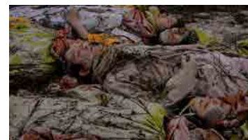
山城知佳子《土の人》2017 10 協力：あいちトリエンナーレ 2016

アジアの境界を超えて人間を深いところから祝福するような山城知佳子の傑作「土の人」や、世界大戦時の特殊な記憶を現代の問題として映し出す小泉明朗の「捕らわれた言葉」など、実話や歴史を題材にユーモアと不条理あふれる物語を通して、社会や人間の本質を探究する日本のアーティストの映像作品選。国際的な評価を得る日本の作家がドキュメンタリーや映画とは異なる映像表現によって捉えた人間の普遍的な問題とは何かを探ります。