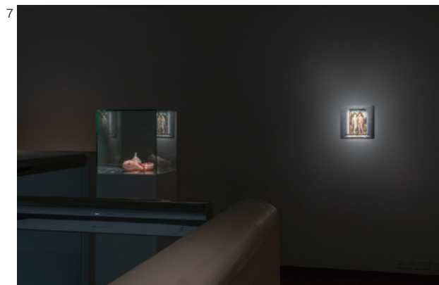
7 「資生堂ギャラリー 第12回shiseido art egg 佐藤浩一展」