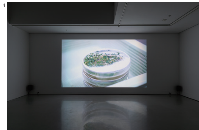
4 「資生堂ギャラリー 第12回shiseido art egg 佐藤浩一展」