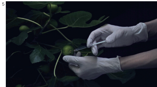
《Breeding Institution II》(部分) 2018