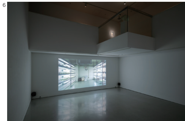
6 「資生堂ギャラリー 第12回shiseido art egg 佐藤浩一展」

※アーカイブのため、後日、掲載誌（紙）、URL、番組収録のDVD、CDなどをお送りください。以上、ご理解・ご協力のほど、何とぞよろしくお願いいたします。