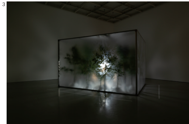
3 「資生堂ギャラリー 第12回shiseido art egg 佐藤浩一展」

まもなく壁の外側にあるものとの接触によって、庭園の秩序は乱されるだろう。しかし私は、壁の崩壊を必ずしも否定的には捉えない。私たちの秩序の荒廃は、「私たちならざる」秩序や主観性の復権でもある。人間的なるもの後退によって浮かび上がる優美さ、官能、愛を、私は見てみたい。昼でも夜でもない鉛色の園地、液状化する冷たいフィールド。獣のような、あるいは植物のような姿へと変貌を遂げた私たちが、すべるように地を這う様を想像してみる。