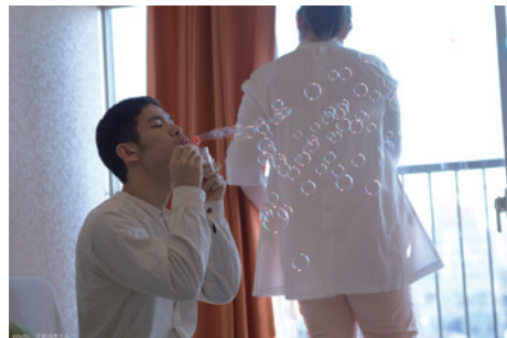
『What's Heaven Like?』