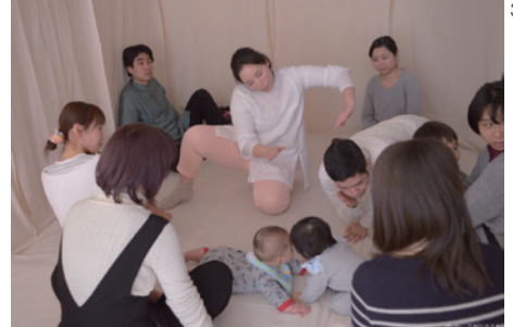
『What's Heaven Like?』

進行役の語りに合わせ、おうちの方がお子さんに向かって動いてみせたり、身近なものを使って音を出したり、パソコンから聞こえる演奏にお子さんと一緒に耳を傾けたりしていると・・・あれよあれよという間に、皆さんのおうちにオリジナルの「ベビーシアター」が出来あがります。テーマは「Heaven」。生まれる前にいたところ、死んだ後に帰るところ。私たちはどこから来てどこに行くのだろう？赤ちゃんの間接を通して、世界の美しさに出会う時間。お子さんと一緒におうちの中でちょっと不思議な旅に出かけましょう。