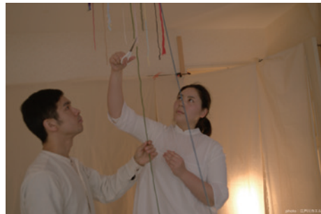
『What's Heaven Like?』

※アーカイブのため、後日、掲載誌（紙）、URL、番組収録のDVD、CDなどをお送りください。以上、ご理解・ご協力のほど、何とぞよろしくお願いいたします。