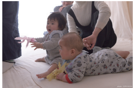
『What's Heaven Like?』