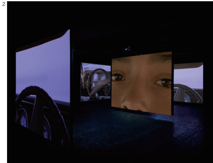
Doug Aitken, i am in you , 2000, Installation view: Galerie Hauser & Wirth & Presenthuber, Zürich, 2000, © Doug Aitken, Courtesy of the artist; 303 Gallery, New York; Galerie Eva Presenthuber, Zurich; Victoria Miro Gallery, London; and Regen Projects, Los Angeles

ダグ・エイケンによる映像インスタレーションのダイナミズムを金沢21世紀美術館の大空間で体感していただける貴重な機会となるでしょう。