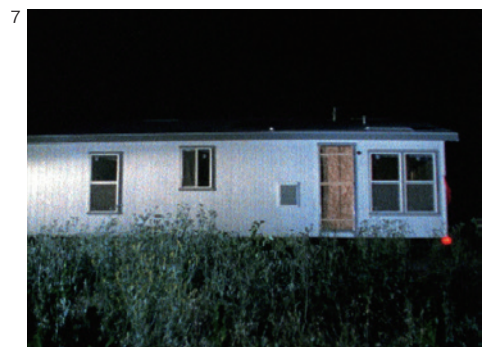
4-7. Doug Aitken, i am in you , 2000, Film still, © Doug Aitken, Courtesy of the artist; 303 Gallery, New York; Galerie Eva Presenhuber, Zurich; Victoria Miro Gallery, London; and Regen Projects, Los Angeles