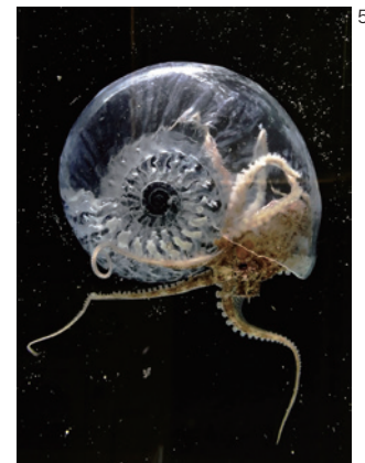
AKI INOMATA 《進化への考察 #1: 菊石(アンモナイト)》

本作は、イカやタコの近縁種であると言われているアンモナイトの殻の形状を、化石のCTスキャンデータから復元し、タコと出会わせた様子を写した映像です。3億年間繁栄したアンモナイトは、6,600万年前に恐竜とともに絶滅しました。一方、タコは進化の過程で貝殻(シェル)を捨てたとされており、柔らかく傷つきやすいその身を守るため、二枚貝などを使って護身することが知られています。本作は、殻に守られたアンモナイトから殻を捨てたタコへと向かう進化の物語に着想を得た、タコとアンモナイトが時間を超えて出会うという、思考実験の旅へと私たちを誘います。