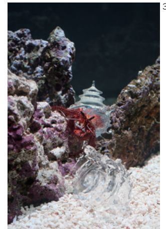
AKI INOMATA 《やどかりに「やど」をわたしてみる》 ©Nantes Metropole - Nantes Art Museum - Photograph: C. Clos

本作では、作家が制作した世界各地の都市に模した樹脂製の「やど」をやどかりが背負っています。引っ越し先を選ぶのはあくまでやどかりですが、一方でどの都市を背負っているかという外側の殻の部分、すなわち「シェル」でしか私たちはこのやどかりのアイデンティティを判別できないのではないのでしょうか。INOMATAは、ここに人種、性別、国籍、学歴、外見などのカテゴリーで他者のアイデンティティを判別するばかりの人間社会を重ね合わせます。やどかりは常に自分に合う引っ越し先を探していますが、それは常に平和的ではなく、他のやどかりを暴力的に追い出しやどを奪うこともあります。身を守るための外殻は同時に、その中身とは関係なく、私たちが何者であるかを規定することがあり、また争いの火種となることもあるのです。透明な都市へと引っ越しを続けるやどかりの姿から、私たち自身の「やど」について考える機会を本作は与えてくれるでしょう。