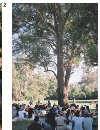
UNDER A TREEのタイトル通り、音に惹かれて人々が木の下に集い寛いでいる。