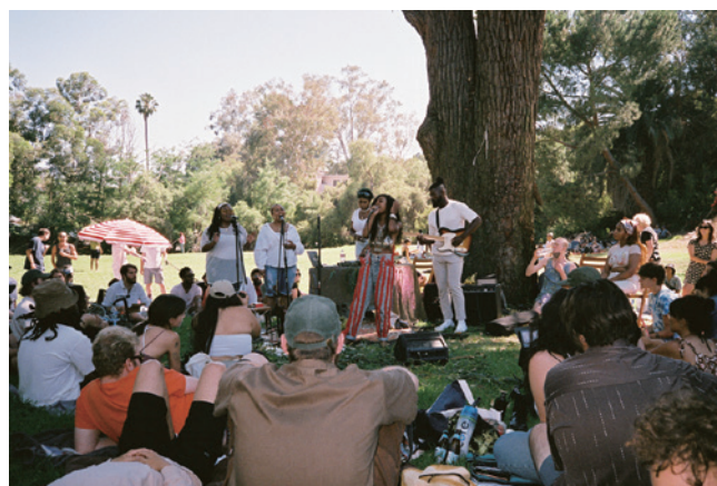
エリシアン・パーク(米国ロサンゼルス)でのUNDER A TREEの様子

https://leavingrecords.com/listen-to-music-outside-in-the-daylight-under-a-tree